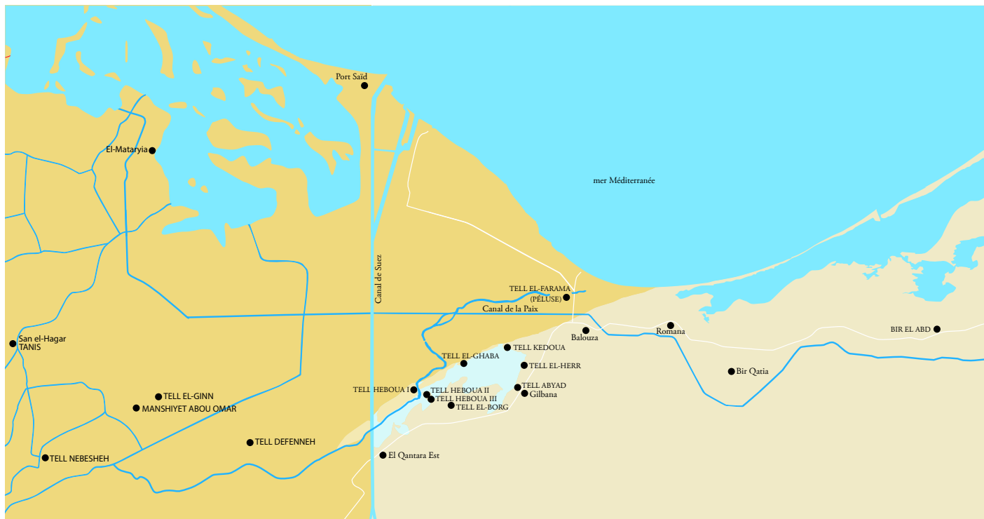
Carte du Nord-Sinaï et du delta Oriental [dessin : N. Favry].

Defernez C., Favry N., Banaszak A. & Qahéri S., « Mission archéologique franco-égyptienne de Tell el-Herr. Premier bilan de l'étude du matériel archéologique (2020) », BAEFE , 2021 [en ligne : http://journals.openedition.org/baeфе/2870 ].